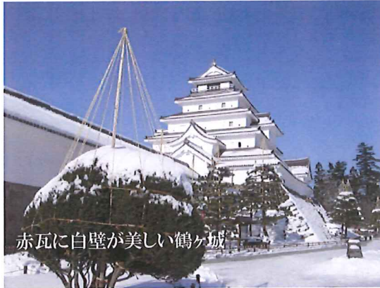
赤瓦に白壁が美しい鶴ヶ城