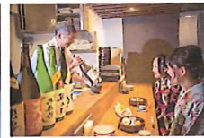
左:田事の名物「めつば飯」 中:徳一の「手打ちそば」 右:会津地酒が飲める「芳」