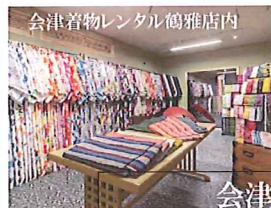
会津着物レンタル鶴雅店内