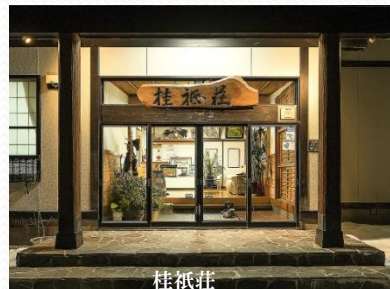
桂祇荘 (天栄村 二岐温泉)