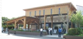
上:道の駅 羽鳥湖高原 下:道の駅 季の里天栄