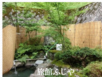
旅館ふじや (天栄村 二岐温泉)