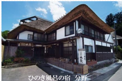
ひのき風呂の宿 分野 (天栄村 岩瀬湯本温泉)