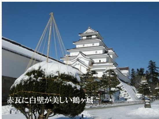
赤瓦に白壁が美しい鶴ヶ城